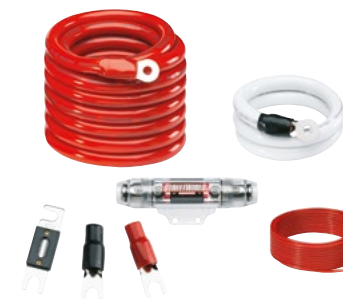
Pack Alim 50mm 2 ZNX50K